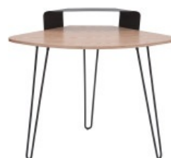
Bureau d'angle QUARTER