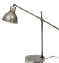
Lampe à poser SHELTER