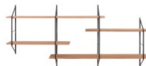
Étagère murale BRIDGE