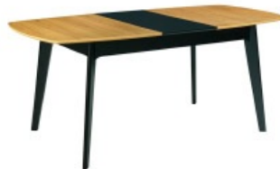
Table extensible MEENA