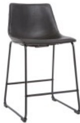
Tabouret de bar NEW ROCK