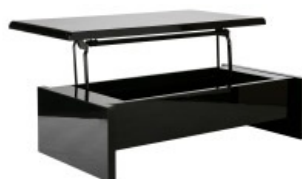
Table basse LOLA