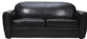
Canapé lit CLUB