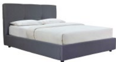
Lit coffre SOGNO