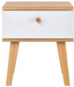
Table de chevet MAHE