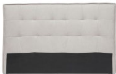
Tête de lit SUKA

Grâce à du meublier transformable et/ou modulable comme les canapés convertibles, les structures intégrées avec des tiroirs ou des niches de rangement, les meubles de compléments et d'appoint retrouvent de l'importance. Coffres, consoles, bancs, commodes, miroirs, paravents, tables de chevet... offrent de vraies fonctionnalités . À découvrir sur miliboo.com