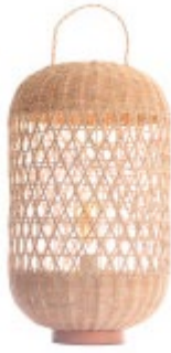
Lampe de sol MOOREA