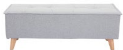
Bout de lit SUKA