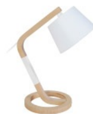
Lampe à poser TWIST