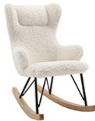
Rocking chair SHAUN