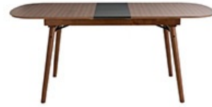
Table à manger SHELDON