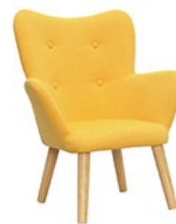
Fauteuil enfant BRISTOL