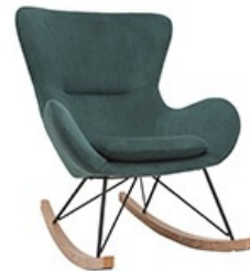
Rocking chair ESKUA