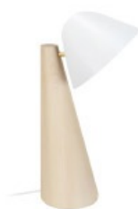
Lampe de chevet FARO