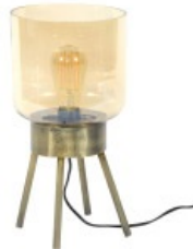
Lampe à poser AMBRE