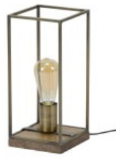
Lampe à poser SOCKEL