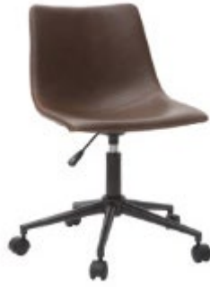
Chaise NEW ROCK