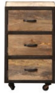
Caisson de bureau INDUSTRIA