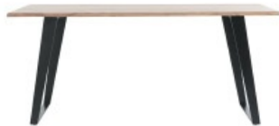
Table à manger KORA