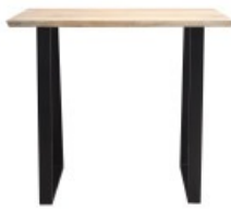
Table de bar VIJAY