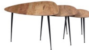
Tables gigognes STONES