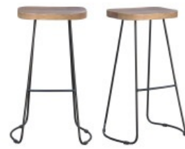
Tabourets de bar RUNKO