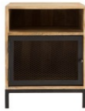
Table de chevet RACK