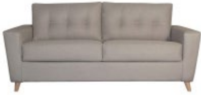
Canapé convertible BEAUBOURG