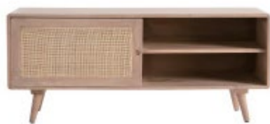
Meuble TV ACANGE