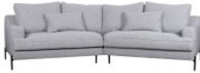
Canapé d'angle PUCHKINE