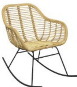
Rocking chair MALACCA