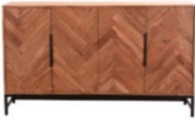
Buffet en acacia STICK