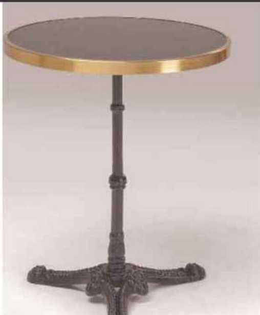
Table bistrot , Kare Design, plateau 57 cm, 219 €, kare24.fr

Pour en dénicher une vraie de vraie, avec plateau massif en marbre, rond entouré de laiton ou carré en bois, il faudra vous armer de patience et surfer sur les sites de seconde main, comme Le Bon Coin ou eBay. Mais on trouve de bonnes imitations pour différents budgets. Chez le fabricant français de mobilier design Miliboo, Maisons du monde, ou parmi la sélection de La Redoute, par exemple. Bonne pioche : la table ronde de la marque française Kare Design et son robuste plateau en marbre.