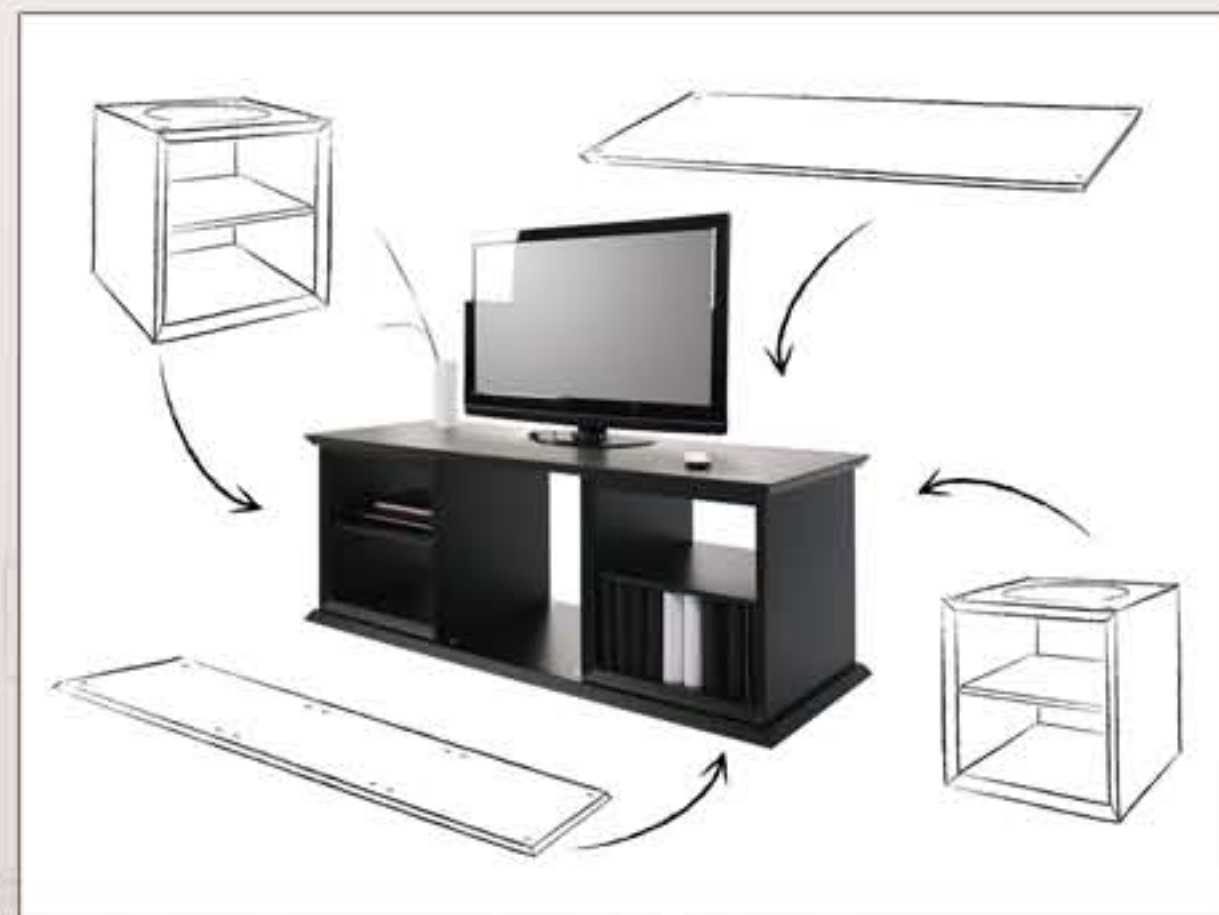
Exemple Meuble TV