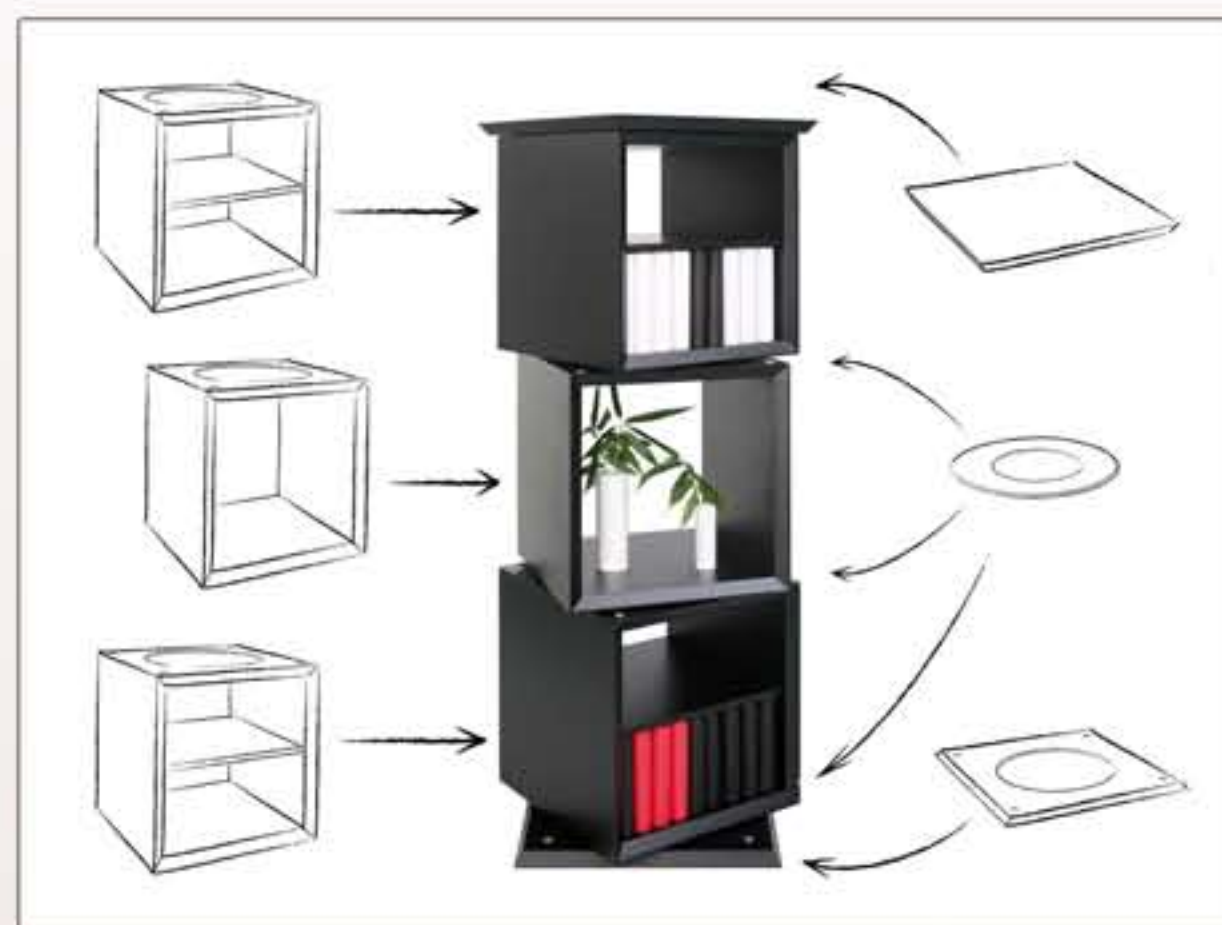
Exemple étagère pivotante